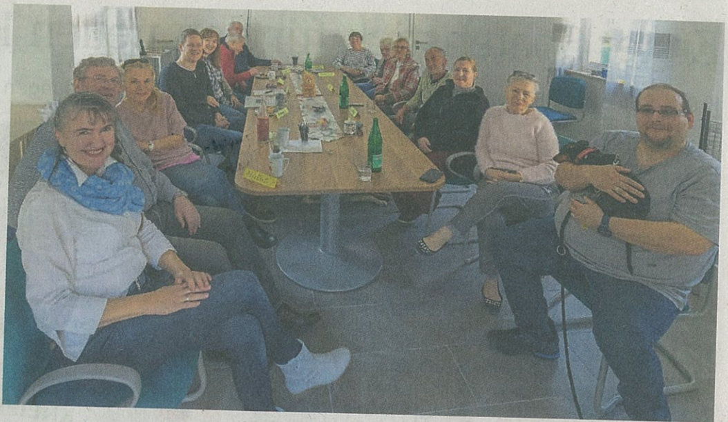
Wie berät man am besten? Bei einem Seminar arbeiteten die Mitglieder der Tierfreunde Dieburg im Seminar einen Leitfaden aus.

der Linie 674 in Richtung Darmstadt über die Hochschule Süd und gefahren. Die Haltestelle Nord entfällt in die g. Die Fahrt um 14.20 le 674 ab Bahnhof Diehtung Ober-Roden bealtestellen Kirche und Nord nicht. Die Linie die Haltestellen in beingen auf der Umleie in Dieburg nicht. Die on Ober-Roden komichtung Dieburg hält Haltestelle Gewerbeährt ab der Lagerstrae die Frankfurter Strahof in Dieburg. Fahr auch entsprechende hänge an den Bushalchten, rät die Dadina.